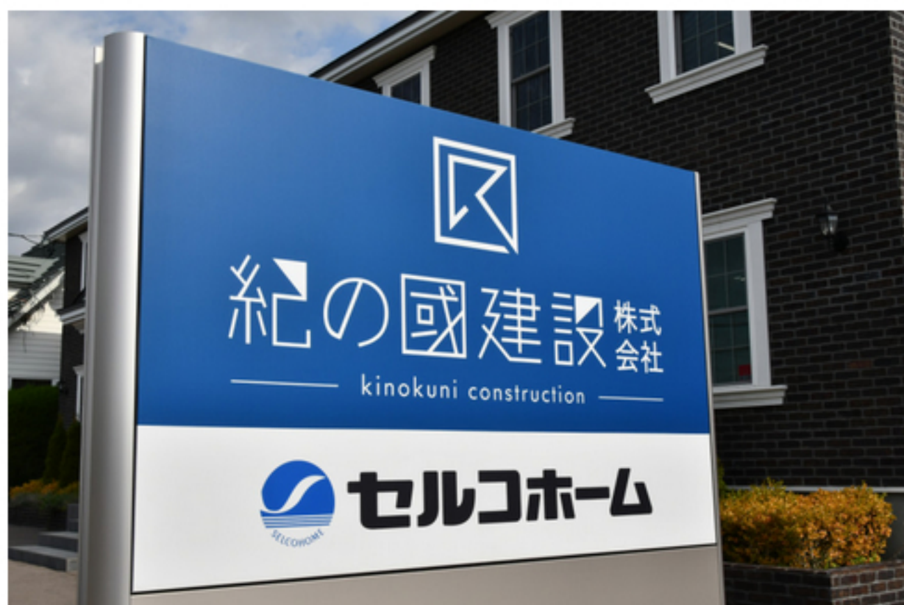
創業60周年に合わせてロゴを一新