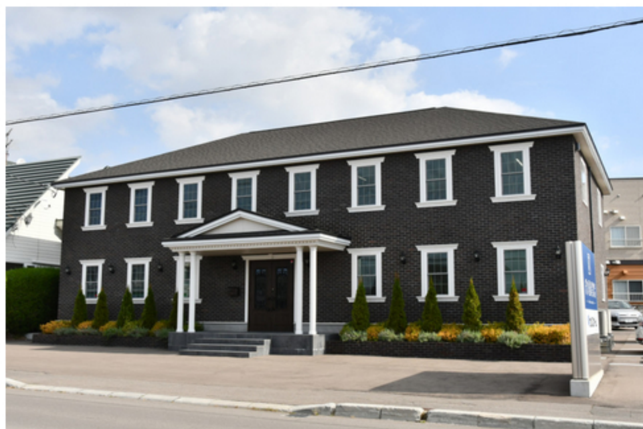
2020年に移転新築した函館市昭和1の本社